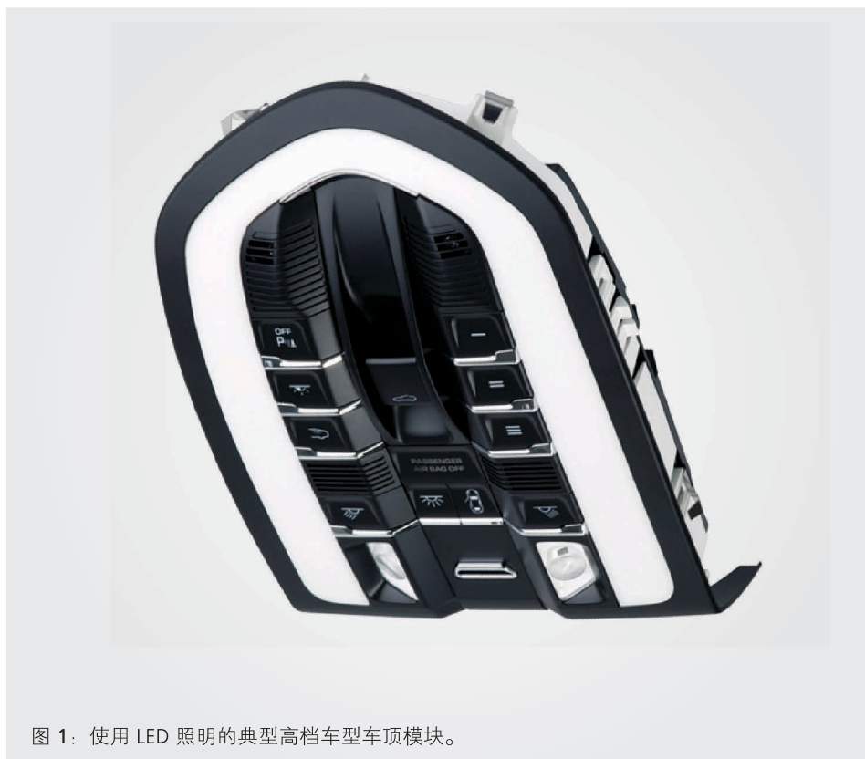
图 1：使用 LED 照明的典型高档车型车顶模块。

Richwin 解释了仿真如何成为 KOSTAL 设计过程的重要组成部分：“我们有一些专门的工具，如用于机械设计的 FEA 软件，但随着热仿真的需求越来越多，并预计会出现对于电磁仿真的需求，于是我开始研究可选的方案。我们选择了 COMSOL Multiphysics，因为它具有迄今为止最好的用户界面，并且能够与 CAD、电气设计和我们使用的制造应用程序进行集成。在 2009 年，我们开始使用该软件进